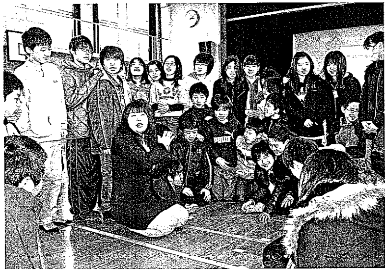
競技かるたが強くなり自信がついて、なんだってできると思うようになりました (3月9日、京都市下京区・京都市立七条第三小学校)